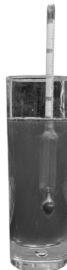
densimeter drijvend in wijn

Bij het maken van wijn laat men druiven gisten. Hierbij wordt suiker omgezet in alcohol. De dichtheid van het mengsel neemt daarbij af. Als je de dichtheid meet weet je dus iets over het alcoholpercentage.